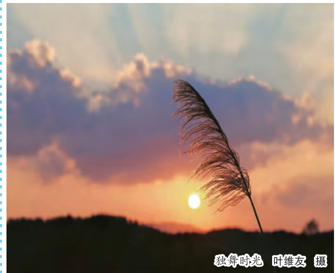
独舞时光