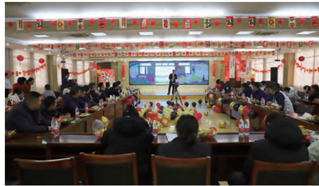
为进一步弘扬中华优秀传统文化，增强群众文化认同感和凝聚力，展现青年人员的青春活力与风采，元宵节前，灌西公司举办青春“元”气喜“宵”颜欢庆元宵联欢会。来自各条战线上的60余名青年员工欢聚一堂。(许东彦)

优管理，保运转，尽心尽力促进发展。健全现代企业制度，立足降本增效总目标，根据“三精管理”行动计划，优化公司各项规章制度，完善绩效考核体系。强化风险分级管控、隐患排查治理，严格风险辨识、隐患排查主体责任落实，全面开展“人、物、环、管”全要素辨识评估。大力推进“学习型、服务型、创新型”企业建设，积极打造“三型”基层单位、“三型”部门。(耿丽圆)