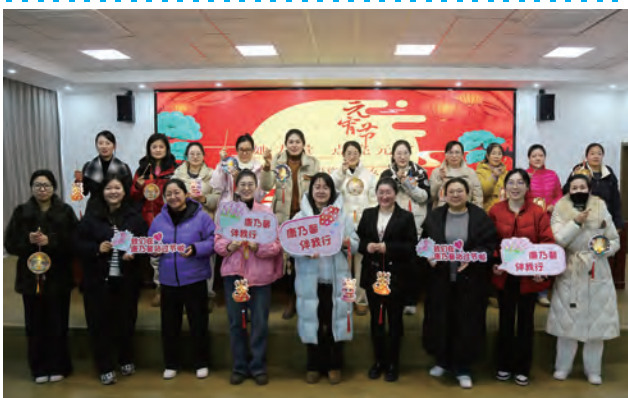
为庆祝元宵佳节，弘扬中华优秀传统文化，展现新时代女性风采，2月12日上午，台北（华茂）公司女工委组织开展“她力量 点亮元宵”手工制作灯笼活动。（宋思雯）

强化纪律意识，擦亮“探照灯”。准确运用“四种形态”，要坚持抓早抓小、防微杜渐，综合运用提醒谈话、批评教育等方式，及时纠正苗头性、倾向性问题。深入学习贯彻落实中央八项规定及其实施细则精神，采取多种形式“打招呼”、明纪律，打好“预防针”，引导党员干部自觉在思想上自省、行动上自律，不断强化纪律规矩意识。（刘嫚嫚）