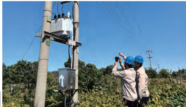
随着气温逐渐回升,连日来,供电公司全面开启春季检修工作,对辖区内电网设备进行“地毯式”体检,确保电网安全稳定运行。(王芬)